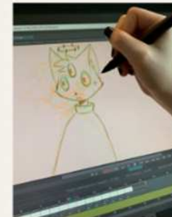
8) Sketching an animation using the studio's Wacom tablet and animation program TVpaint

While interning at Studio PIAF, I finally got to use the Wacom Tablets they provided, with the TVpaint animation program. Here I learned the most. I always was able to ask for direct feedback on my animations, and I could test out different devices to know which one to buy. I even got to see the portfolios they made for art school!