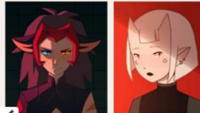
1) A frame from a moving light source animation (Procreate)

The first few weeks where I was working independently were somewhat challenging because I had no access to any fancy animation programs yet - I had to make do with my usual drawing app, Procreate. As a result, my animations were quite short, stiff, and focused more on coloring and shading than movement.