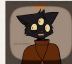
9) A frame from a lip-sync animation (TVpaint)