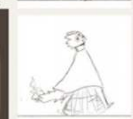
10, 11, 12) My favorite frames from my "character reaction" animation (TVpaint)